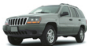
グランドチェロキー